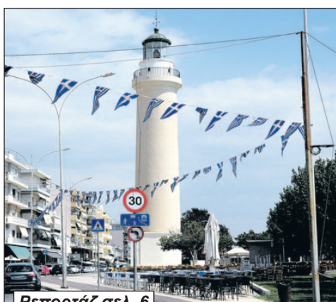
Ρεπορτάζ σελ. 6

Πληρότητες έως 100% στο Μπαϊράμι - Δυναμική εκκίνηση για τη σεζόν, σύμφωνα με τον Αντιδήμαρχο Τουρισμού