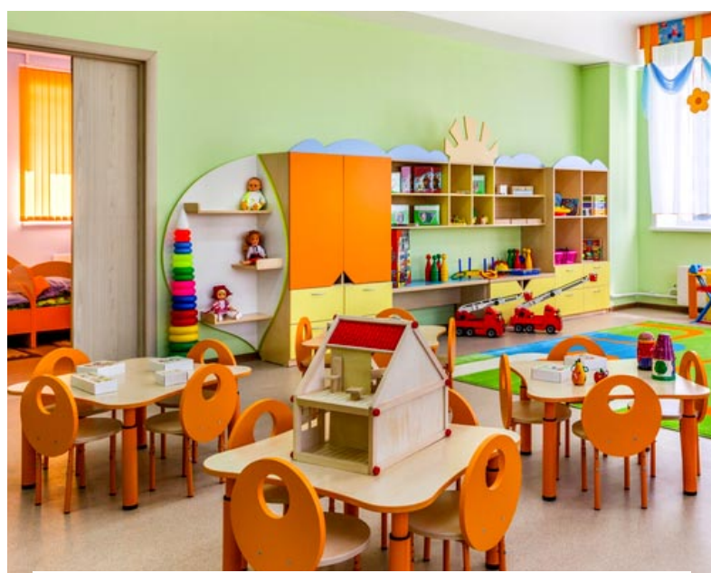
Ομόφωνα εγκρίθηκε από το δημοτικό συμβούλιο Ορεστιάδας η ίδρυση παιδικού σταθμού στα Δίκαια

«Η ιστορία όλη αυτή ξεκίνησε από τον Νοέμβριο, όταν λάβαμε ένα αίτημα από την πρόεδρο των Δικαίων, που μας είπε ότι υπάρχουν κάποιες οικογένειες και κά-