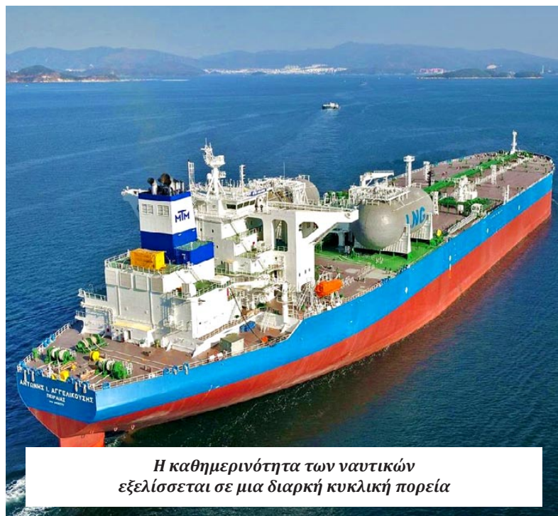
Η καθημερινότητα των ναυτικών εξελίσσεται σε μια διαρκή κυκλική πορεία

Οι απαντήσεις στις κάτωθι ερωτήσεις είναι χαρακτηριστικές Ερώτηση: Πόσα χρόνια εργάζεστε στη ναυτιλία, πόσο καιρό ταξιδεύετε και ποιος είναι ακριβώς ο ρόλος σας στο πλοίο; Σε ποια εταιρεία εργάζεστε και πώς διαμορφώνεται συνήθως