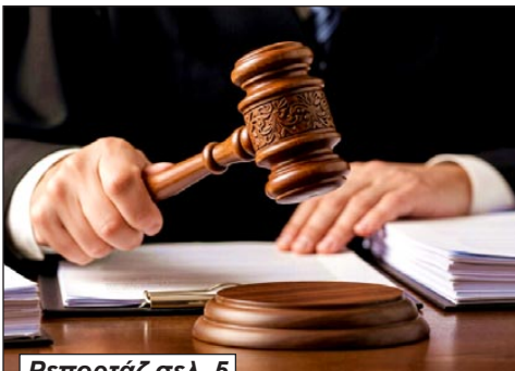
Ρεπορτάζ σελ. 5

Στο εδώλιο νηπιαγωγού και γονείς - Το δικαστήριο αποφάσισε η διαδικασία να διεξαχθεί κεκλεισμένων των θυρών λόγω της σοβαρότητας της υπόθεσης