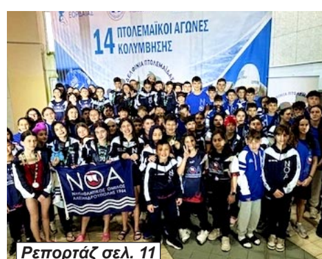
Ρεπορτάζ σελ. 11