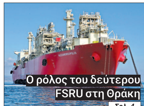
Ο ρόλος του δεύτερου FSRU στη Θράκη