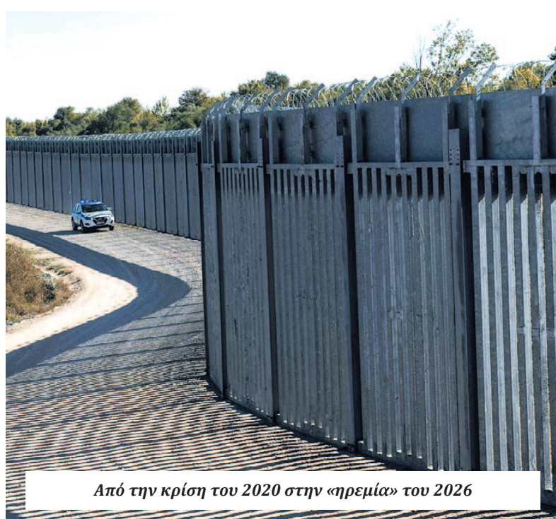
Από την κρίση του 2020 στην «ηρεμία» του 2026