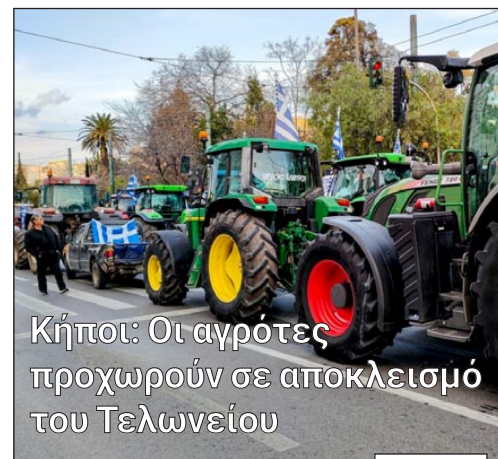
Κήποι: Οι αγρότες προχωρούν σε αποκλεισμό του Τελωνείου