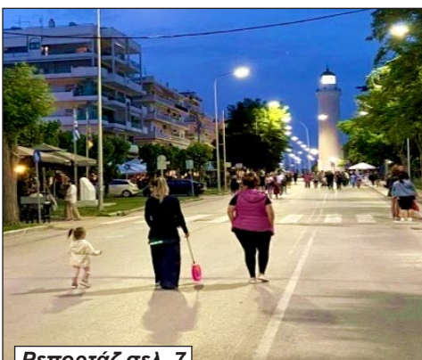
Ρεπορτάζ σελ. 7

Τι συζητήθηκε στην τελευταία συνεδρίαση του Δημοτικού Συμβουλίου Αλεξανδρούπολης - Τα νομικά εμπόδια και οι αντιδράσεις