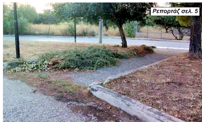
Ρεπορτάζ σελ. 5

Αλεξανδρούπολη: «Ομηρία» στον καθαρισμό κοινόχρηστων χώρων λόγω δικαστικής εμπλοκής Ένσταση «παγώνει» για 52 ημέρες τις εργασίες λίγο πριν την αντιπυρική περίοδο, με τον Δήμο να ψάχνει λύσεις εν μέσω αυξημένου κινδύνου