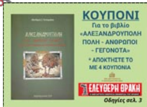
Οδηγίες σελ. 3