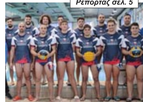
Ρεπορτάζ σελ. 5

Για πρώτη φορά, ομάδα της Αλεξανδρούπολης διεκδικεί την άνοδο στην Α2 πόλο ανδρών!