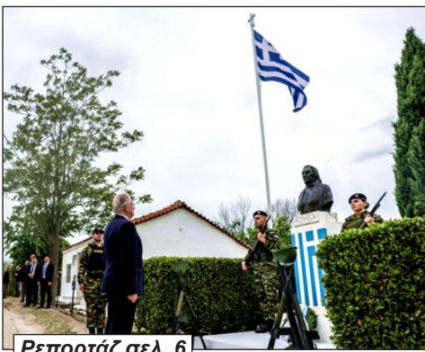
Ρεπορτάζ σελ. 6

Η Πρόεδρος του Δικηγορικού Συλλόγου Ορεστιάδας αναφέρθηκε και στις αναξιοποίητες δυνατότητες της περιοχής