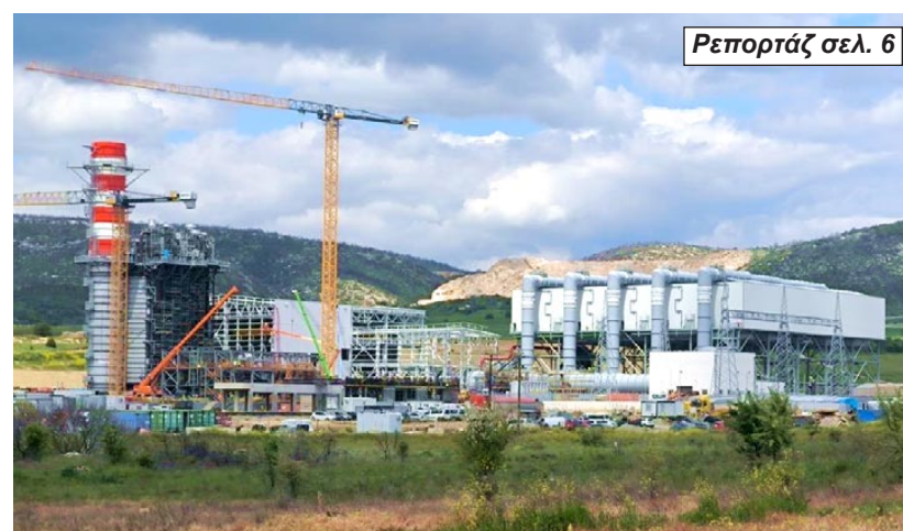
Ρεπορτάζ σελ. 6

Στρατηγικής σημασίας έργο με προοπτική διασύνδεσης και εξαγωγών προς Βαλκάνια - Εκκρεμεί το οριστικό χρονοδιάγραμμα ολοκλήρωσης