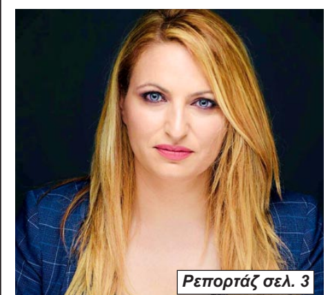
Ρεπορτάζ σελ. 3

Ανοιχτό το ενδεχόμενο να κατεβεί ξανά για βουλευτής στον Έβρο άφησε η Συντονίστρια του Γραφείου Πρωθυπουργού Β. Ελλάδος