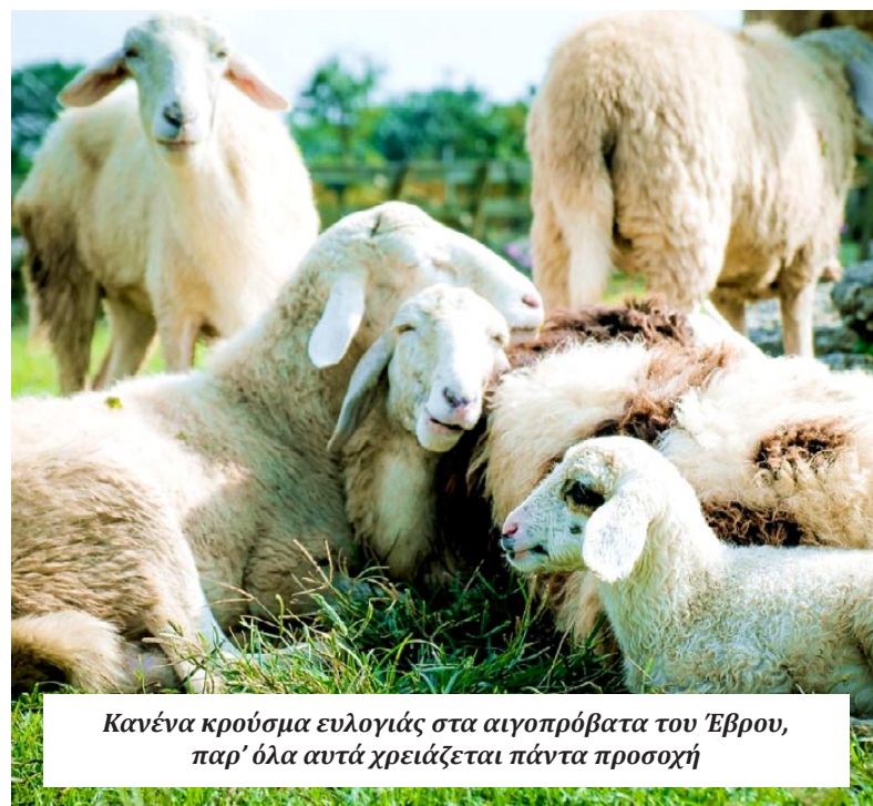
Κανένα κρούσμα ευλογιάς στα αιγοπρόβατα του Έβρου, παρ' όλα αυτά χρειάζεται πάντα προσοχή

Σύμβουλος ΑΜ-Θ, Βασίλης Δελησταμάτης, επιβεβαίωσε την εξάλειψη της νόσου στον νομό, υπογραμμίζοντας παράλληλα την ανάγκη για συνεχή επαγρύπνηση. «Ευχάριστη είναι η κατάσταση στον Έβρο, γιατί μέχρι και σήμερα έχουμε αρκετό χρονικό διάστημα να εμφανιστεί κάποιο κρούσμα στην περιοχή. Για τον Δήμο Ορεστιάδος και τον Βόρειο Έβρο, από το τελευταίο κρούσμα έχουν περάσει περίπου 5 μήνες. Περίπου στους 22 μήνες έχουν περάσει για τα όρια του Δήμου Σουφλίου. Για τις Φέρες είναι περίπου και εκεί στις 20 με 22 μήνες. Στους 5 μήνες είναι η Αλεξανδρούπολη. Άρα, έχουμε μια δικλείδα που μας επιτρέπει να αισιοδοξούμε. Δηλαδή, ενώ σύμφωνα με τα όρια της Ευρωπαϊκής Επιτροπής είναι οι 60 μέρες, εμείς έχουμε περάσει