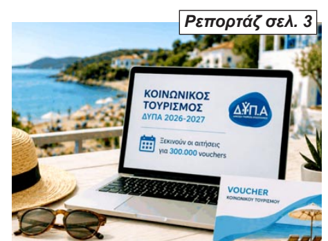
Ρεπορτάζ σελ. 3

Στην αναμονή οι οριστικοί δικαιούχοι - 1 στους 3 μένει εκτός λόγω αυστηρών κριτηρίων