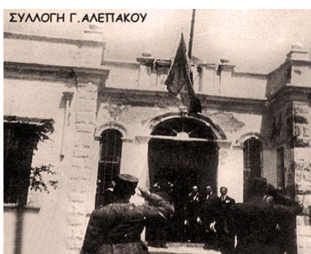
Α του Πέτρου Γ. Αλεπάκου

Είναι γεγονός αδιαμφισβήτητο ότι ο πρώτος οικισμός του Δεδέαγατς άρχισε να θεμελιώνεται εκεί περίπου το 1871 μαζί με τις σιδηροτροχιές και τις πρώτες