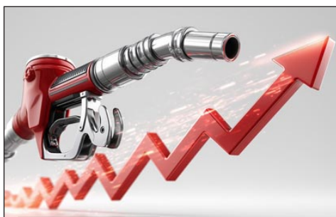
Ρεπορτάζ σελ. 5

Η γεωπολιτική κρίση πιέζει τις τιμές προς τα πάνω - Πολλοί οδηγοί στρέφονται στη Βουλγαρία για φθηνότερη βενζίνη