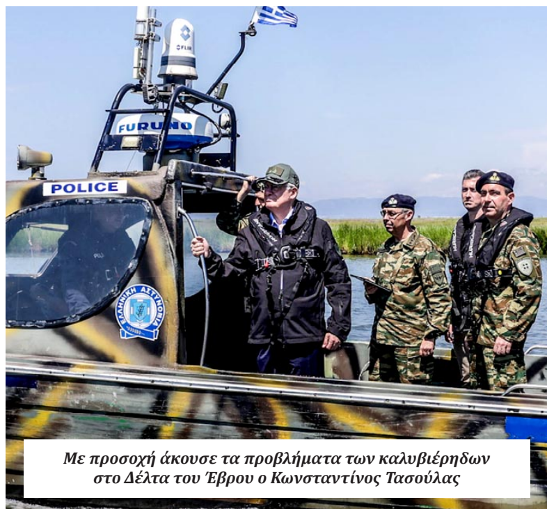
Με προσοχή άκουσε τα προβλήματα των καλυβιέρηδων στο Δέλτα του Έβρου ο Κωνσταντίνος Τασούλας

Σε εκκρεμότητα το Προεδρικό Διάταγμα για τη νομιμοποίηση των καλυβών στο Δέλτα του Έβρου. Σε εξέλιξη παραμένει το χρόνιο ζήτημα που αφορά το καθεστώς νομιμότητας των οικημάτων (καλυβών) στην ευρύτερη περιοχή