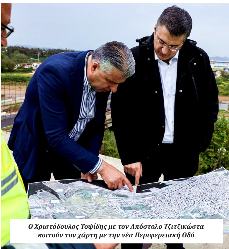
Ο Χριστόδουλος Τσιφίδης με τον Απόστολο Τζιτζικώστα κοιτούν τον χάρτη με την νέα Περιφερειακή Οδό

Πιο αναλυτικά, στην εισήγησή του ο Ευρωπαίος Επίτροπος, Απόστολος Τζιτζικώστας, τόνισε ότι η ο