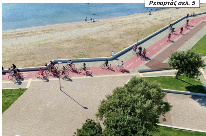
Ρεπορτάζ σελ. 5

Όλο και περισσότεροι δημότες της Αλεξανδρούπολης επιλέγουν το ποδήλατο ως μέσο μεταφοράς - Οι κανόνες ασφαλείας που πρέπει να τηρούνται