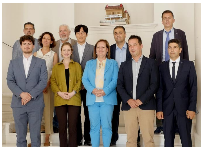
Τα στελέχη του ΟΟΣΑ σε αναμνηστική φωτογραφία στο Νομαρχείο Έβρου

επαφών είναι η συλλογή ακριβών δεδομένων και στοιχείων, τα οποία θα επιτρέψουν τον σχεδιασμό και την εφαρμογή στοχευμένων πολιτικών για την αποτελεσματική αντιμετώπιση του έντονου δημογραφικού προβλήματος που καταγράφεται στην περιοχή του Έβρου. Ειδικότερα, μιλώντας στο ΘΡΑΚΗ NET, ο Περιφερειάρχης Ανατολικής Μακεδονίας & Θράκης, Χριστόδουλος Τσιφίδης, σημείωσε: «Το δημογραφικό δεν είναι ένα πρόβλημα που αφορά μόνο τις γεννήσεις. Είναι ένα πρόβλημα που αφορά πραγματικά την εργασία, τη στέγαση, τις υποδομές, όλα αυτά τα πράγματα, που για να μείνουν κάποιοι νέοι στην περιοχή, χρειάζονται. Και σε αυτό το κομμάτι η Περι-