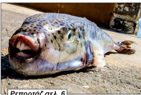
Ρεπορτάζ σελ. 6

Ο ναυαγοσώστης της παραλίας και εργαζόμενοι διαψεύδουν τις φήμες - Τι να κάνετε αν δαγκωθείτε από το ψάρι