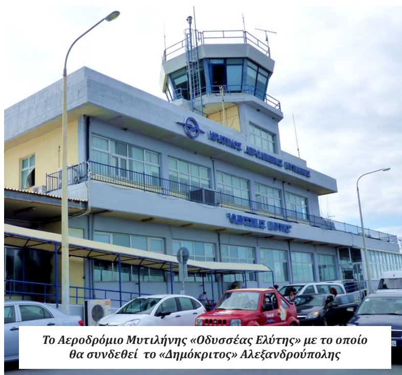
Το Αεροδρόμιο Μυτιλήνης «Οδυσσεύς Ελύτης» με το οποίο θα συνδεθεί το «Δημόκριτος» Αλεξανδρούπολης

ΚΗ NET, δίνοντας όλες τις απαραίτητες πληροφορίες: «Όντως, έχουμε το αποτέλεσμα της προσπάθειας που ξεκίνησε -και έχω και την επιστολή του Περιφερειάρχη εδώ- από τις 15 Απριλίου 2024. Η προσπάθεια ξεκίνησε και αυτή η διασύνδεση έχει με πολύ μεγάλες πιθανότητες επιτυχίας. Προορισμός δεν είναι άλλος από το νησί της Λέσβου, το αεροδρόμιο της Μυτιλήνης δηλαδή. Ο Περιφερειάρχης, σε συνεργασία με τον Περιφερειάρχη Βορείου Αιγαίου, ξεκίνησαν μια προσπάθεια από τότε προς την Αρχή Πολιτικής Αεροπορίας που ουσιαστικά αποφασίζει ποια άγονα δρομολόγια θα επιδοτηθούν και ποια θα μπουν στις προκηρξίες για να τα αναλάβουν συγκεκριμένες αεροπορικές εταιρείες», σημείωσε αρχικά ο κ. Ζατανανιδής. Πρόκειται για μια πτήση η οποία,