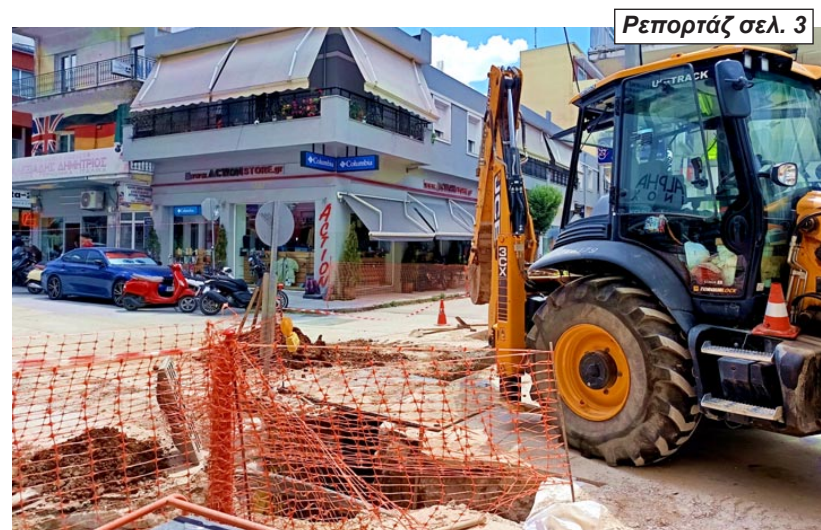
Ρεπορτάζ σελ. 3

Για τα έργα φυσικού αερίου στη Βενιζέλου - Υποτίθεται ότι θα τέλειωναν στις 17 Ιουνίου - Κανένας σεβασμός στους δημότες με την μη τήρηση των χρονοδιαγραμμάτων