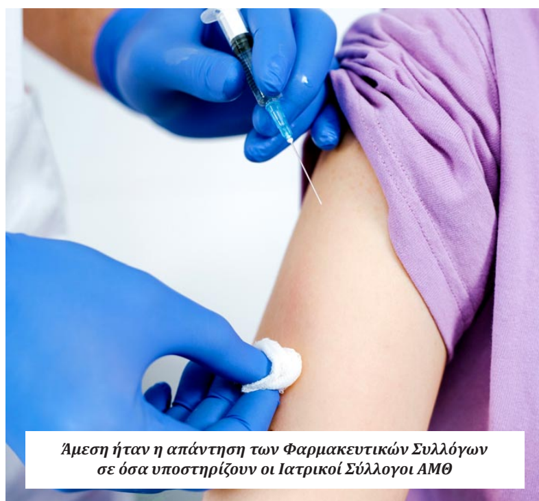
Άμεση ήταν η απάντηση των Φαρμακευτικών Συλλόγων σε όσα υποστηρίζουν οι Ιατρικοί Σύλλογοι ΑΜΘ

Με το σκεπτικό αυτό, η ελληνική πολιτεία το 2024 με τον νόμο 5102 προέβη σε μία διορθωτική έως τότε στρέβλωση και σε μία εναρμόνιση με τις πρακτικές που ακολουθούνται ανά την Ευρώπη και πλέον όλα τα εμβόλια του Εθνικού προγράμματος Εμβολιασμού ενηλίκων μπορούν να διενεργούνται στο ελληνικό φαρμακείο. Αυτό επί της ουσίας