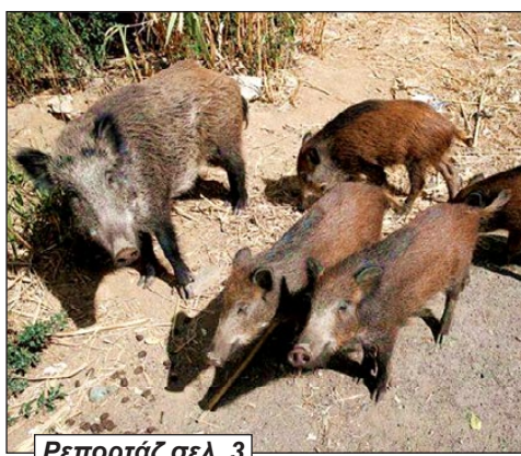
Ρεπορτάζ σελ. 3

Αυξάνονται οι εμφανίσεις κοντά σε σπίτια και καλλιέργειες - Αναστάτωση στους κατοίκους της περιοχής