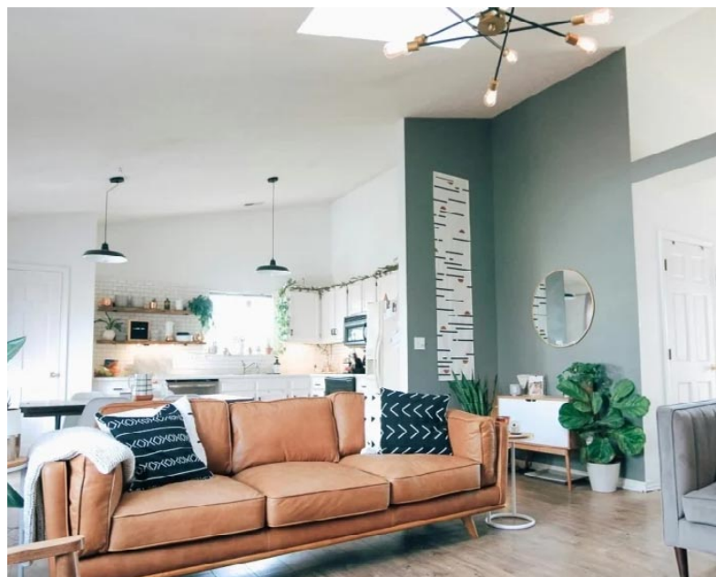
Αρκετά τσουχτερά είναι τα μισθώματα AIRBNB στην Αλεξανδρούπολη

τελευταία χρόνια, λόγω των Τούρκων, των Βουλγάρων και των Ρουμάνων. Και βλέπετε ότι υπάρχει πάρα πολύς κόσμος ο οποίος παραθερίζει τελικά στην Αλεξανδρούπολη, σχεδόν όλα δουλεύουν. Τα Σαββατοκύριακα το καλοκαίρι δεν θα βρεις διαθέσιμο ούτε ξενοδοχείο ούτε κατάλληλο Airbnb».