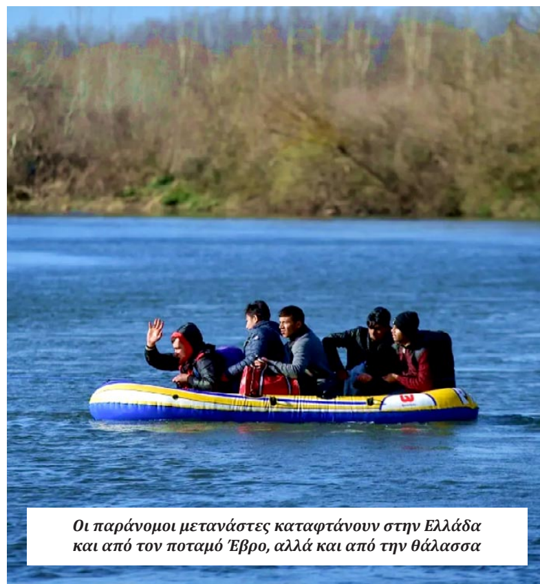
Οι παράνομοι μετανάστες καταφτάνουν στην Ελλάδα και από τον ποταμό Έβρο, αλλά και από την θάλασσα

τον Ιανουάριο έως και τον Ιούνιο του 2026 πραγματοποιήθηκαν στην Περιφέρεια Ανατολικής Μακεδονίας και Θράκης 4.102 συλλήψεις σε υποθέσεις που αφορούν αλλοδαπούς, έναντι 2.339 συλλήψεων το αντίστοιχο διάστημα του 2025. Η μεταβολή αυτή αντιστοιχεί σε αύξηση της τάξης του 43%, στοιχείο που αποτυπώνει το μέγεθος της επιχειρησιακής δραστηριότητας που αναπτύσσεται στην περιοχή. Η ανάλυση των στοιχείων δείχνει ότι η μεγάλη πλειονότητα των συλληφθέντων αφορά παράτυπους μετανάστες, πρόσφυγες, αλλά και άτομα που συμμετέχουν σε οργανωμένα κυκλώματα διακίνησης. Οι περισσότεροι είχαν εισέλθει στην ελληνική επικράτεια μέσω της συνοριακής γραμμής του Έβρου, η οποία εξακολουθεί να αποτελεί το βασικό πεδίο πίεσης για τις ελληνικές αρχές. Χαρακτηριστική της δράσης των