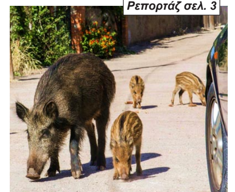
Ρεπορτάζ σελ. 3

Πολίτες ταΐζουν τα άγρια ζώα, με αποτέλεσμα να κατεβαίνουν πιο συχνά στους δρόμους