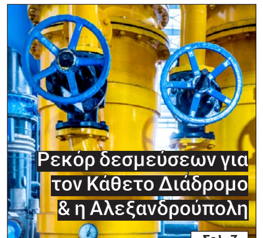
Ρεκόρ δεσμεύσεων για τον Κάθετο Διάδρομο & η Αλεξανδρούπολη