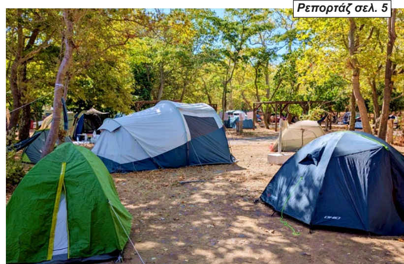
Ρεπορτάζ σελ. 5

Ζητούμενο οι συνεχείς αστυνομικές παρεμβάσεις και η διαρκής εφαρμογή της νομοθεσίας - Τι δήλωσε στο ΘΡΑΚΗ NET ο Παναγιώτης Λαμπρόπουλος