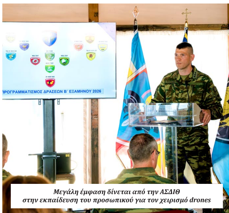
Μεγάλη έμφαση δίνεται από την ΑΣΔΙΘ στην εκπαίδευση του προσωπικού για τον χειρισμό drones

θα γίνει αγώνας γιατί τα 100 χρόνια από την χάραξη των συνόρων, που συμμετέχει και 12 η Μεραρχία σε όλες αυτές τις εκδηλώσεις και συνεργάζεται για τον αγώνα δρόμου και όλα αυτά». Σε ό,τι αφορά τις αμιγώς στρατιωτικές δράσεις, αυτές δίνουν ιδιαίτερη βαρύτητα στον χειρισμό και τον εντοπισμό των drones που αποτελούν νέα σύγχρονα όπλα. Μάλιστα, οι εκπαιδευσεις έχουν διπλό σκοπό, στοχεύοντας τόσο στον χειρισμό, όσο και στον εντοπισμό των drones. «Τώρα ασχολούμαστε μόνο με τα δικά μας και αυτά που έχουμε και χειριζόμαστε. Και θα πάω από πίσω προς τα προς, ξεκινώντας από το 316 Συνεργείο Περιοχής, το οποίο έχει αρχίσει την κατασκευή